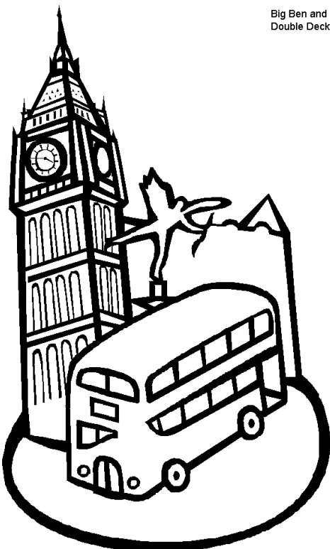
Big Ben and Double Decker Bus

a bell = une cloche a tower = une tour great = grand, géant